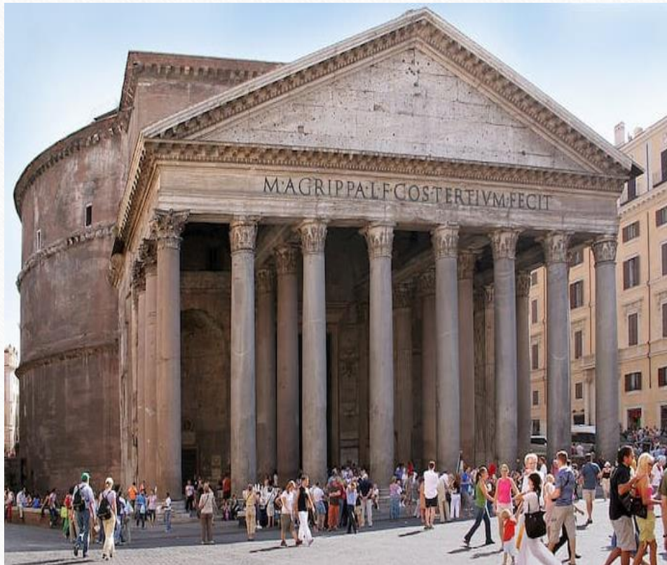
Храм Пантеона. 118-128 гг. н.э.

Архитектура Древнего Рима оказала огромное влияние на современную архитектуру. Например, главное здание музея изобразительных искусств имени А. С. Пушкина построено по проекту архитектора Романа Клейна в неоклассическом стиле в виде античного храма.