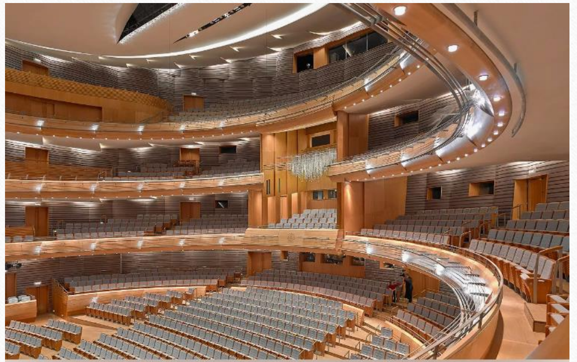
Новый зал Мариинского театра. Санкт-Петербург