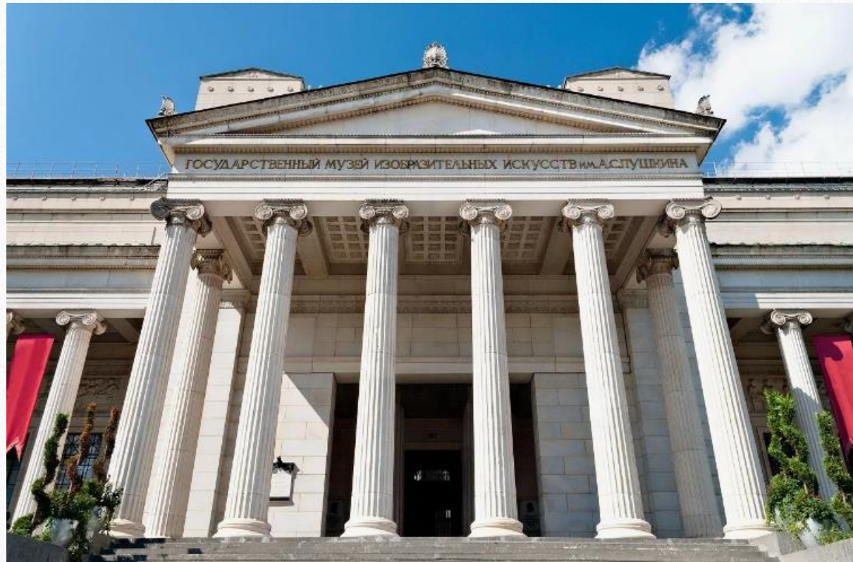
Главный корпус музея Изобразительных Искусств им. А.С.Пушкина.