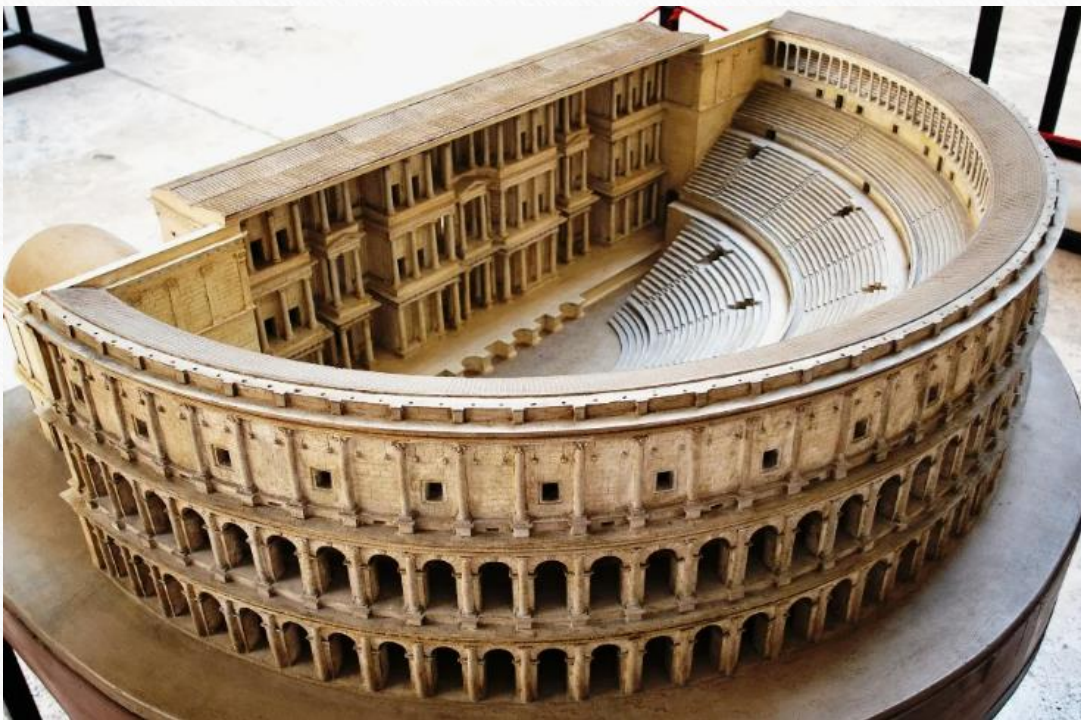
Римский театр Марцелла. Реконструкция

Современные театры строятся по тому же принципу, что и театры, создаваемые античными Римлянами: полукруглая зрительная часть зала, из которого открывается вид на сцену.