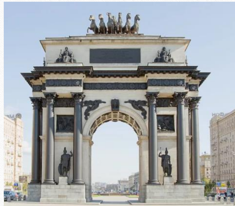
Московские Триумфальные ворота (Триумфальная арка) 1834 г.