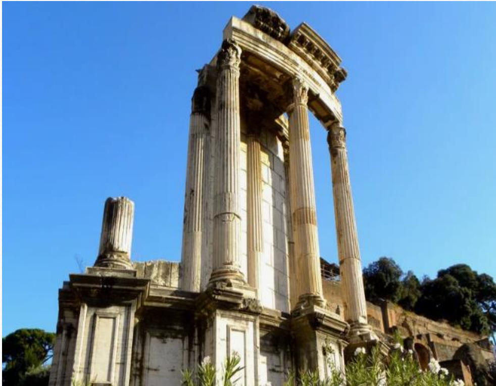
Храм Весты. VII век до н.э.

Главный корпус МПГУ построен в стиле неоклассицизма, т.е. стиля, опирающегося на образцы архитектуры Древней Греции и Древнего Рима. Купольную ротонду Главного корпуса МПГУ можно сравнить с такой постройкой Древнего Рима, как Храм Весты