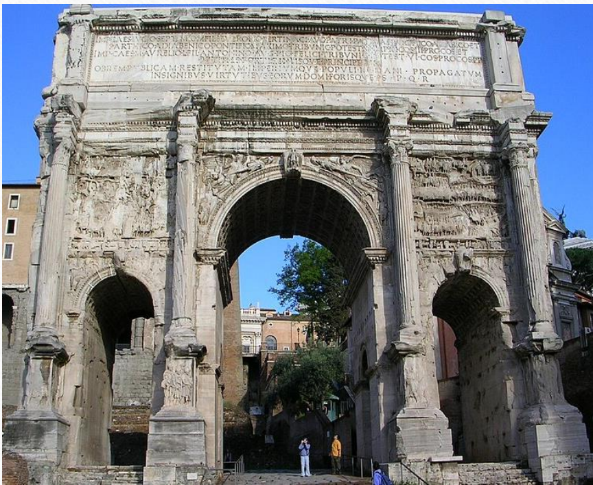
Триумфальные ворота Септимия Севера. 203 год н.э.

Цель проекта: доказать значимость изучения искусства древнего мира для современного общества и показать, как элементы этого искусства используются человеком сейчас в разных сферах жизни.