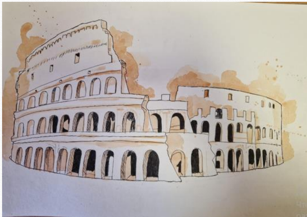
Колизей. Собственный рисунок

Колизей. Амфитеатр впервые был упомянут в 80 году н.э. Размеры Колизея вызывают восхищение. Высота стен достигала около пятидесяти метров, диаметр 188 метров. 80 входов и 50 000 мест доказывают величие этой достопримечательности.