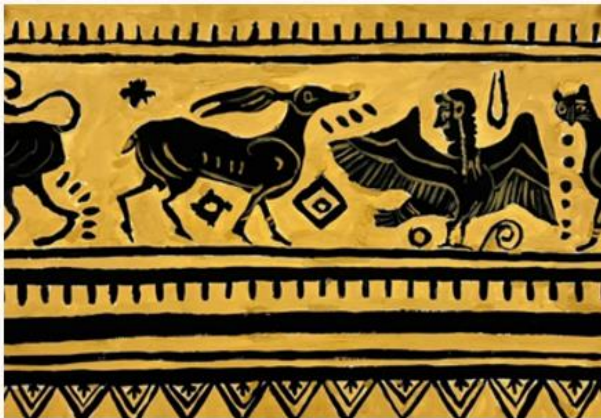
Элемент вазописи Древней Греции. Чернофигурный стиль. Собственный рисунок.