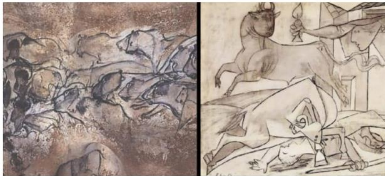
Пещера Шове; Пабло Пикассо, эскиз "Герника" 1937 г.

«За семнадцать тысяч лет мы ничего нового не изобрели», — воскликнул Пабло Пикассо после посещения в 1940 году пещеры Ласко.