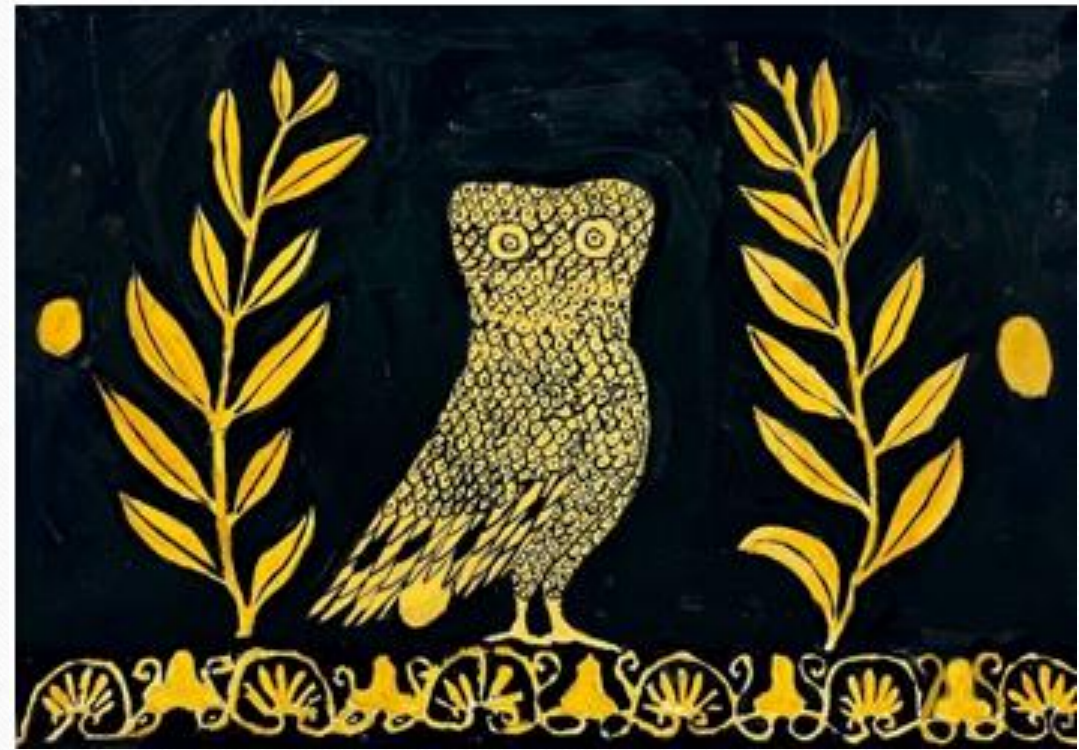
Вазопись краснофигурный стиль. Собственные рисунки.