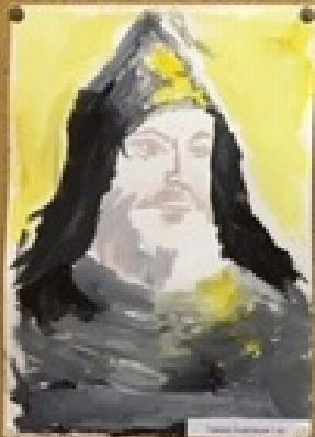
Князь Владимир Великий