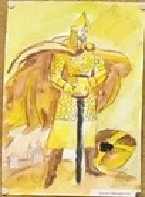
Князь Владимир Великий