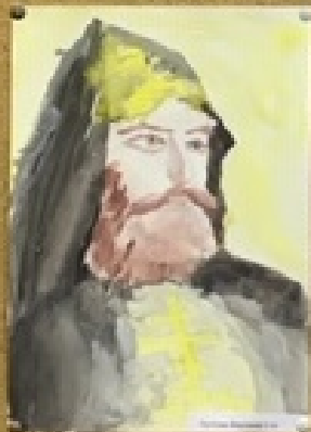
Князь Владимир Великий