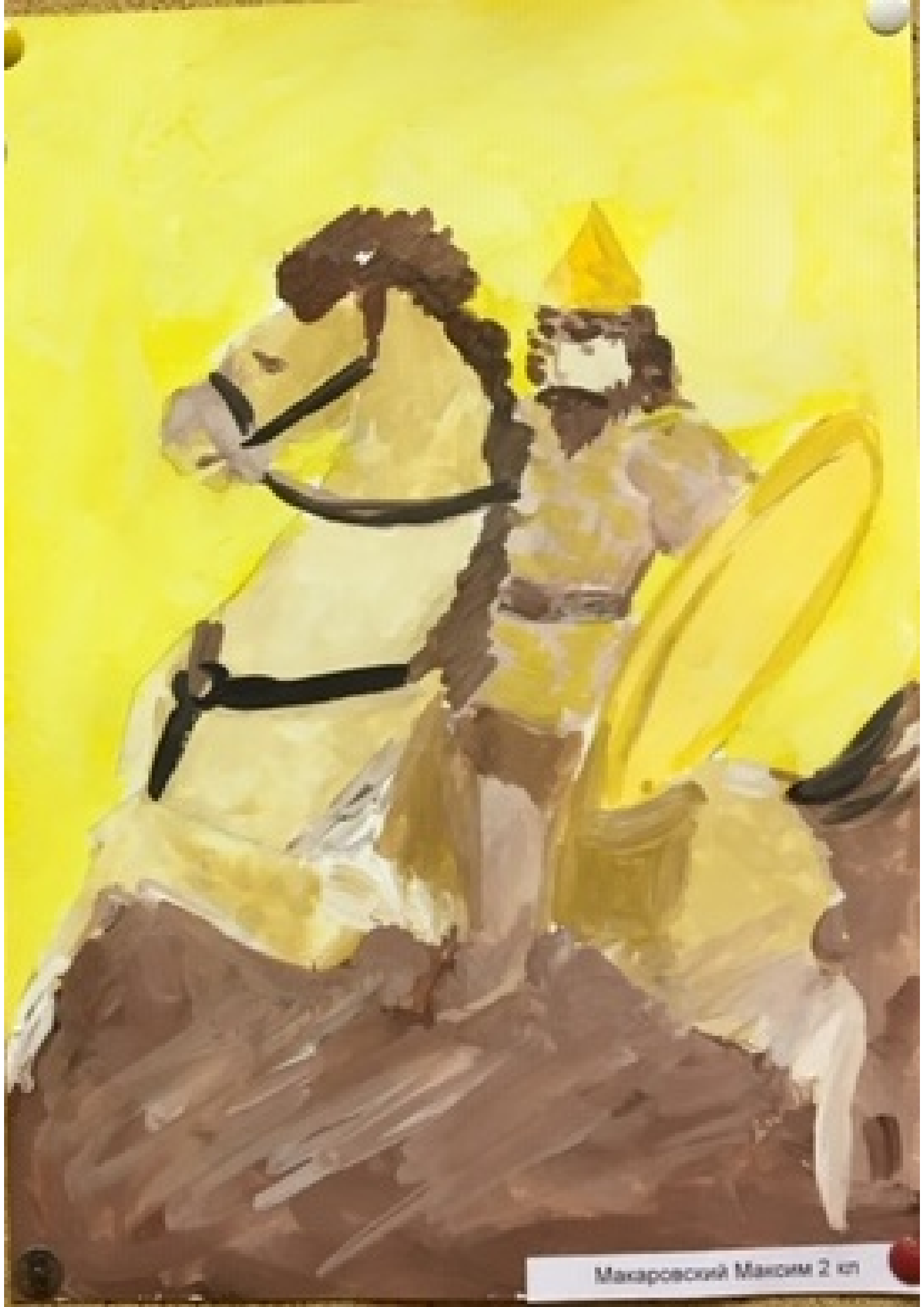
Макаровский Максим 2 кл