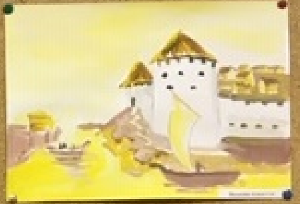
Кремль в Киеве